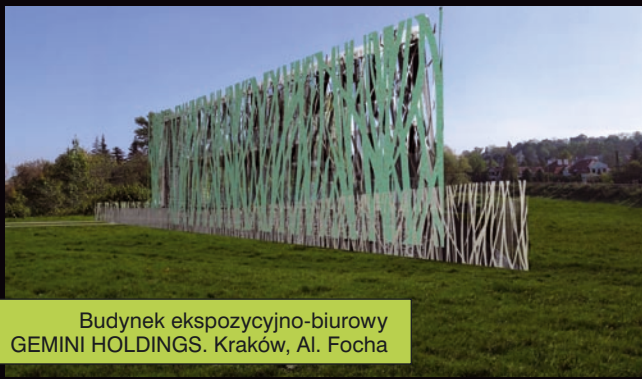
Budynek ekspozycyjno-biurowy GEMINI HOLDINGS. Kraków, Al. Focha