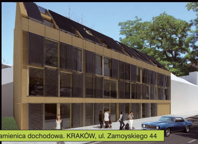
Kamienica dochodowa. KRAKÓW, ul. Zamoyskiego 44