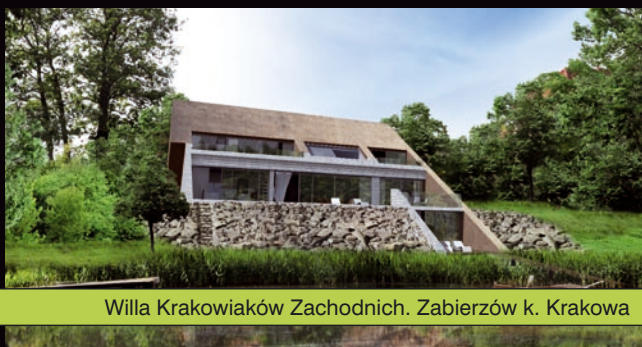
Willa Krakowiaków Zachodnich. Zabierzów k. Krakowa