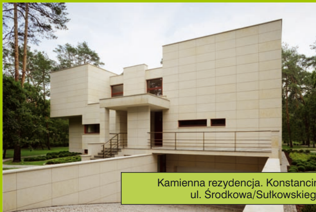
Kamienna rezydencja. Konstancin, ul. Środkowa/Sułkowskiego

Dobrą miarą sukcesu architektonicznego jest spełnianie potrzeb ludzi, bo to oni są prawdziwymi bohaterami architektury.