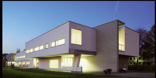
Nowy gmach Zespołu Szkół Społecznych, Społecznego Towarzystwa Oświatowego. Kraków, ul. Senatorska