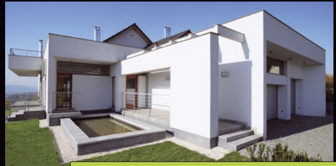
Willa jurajska. Bolechowice koło Krakowa