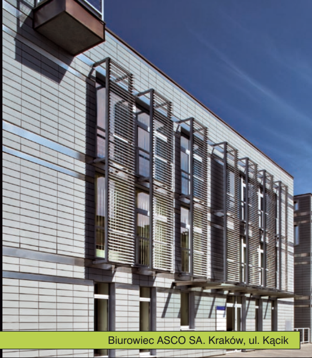
Biurowiec ASCO SA. Kraków, ul. Kącik