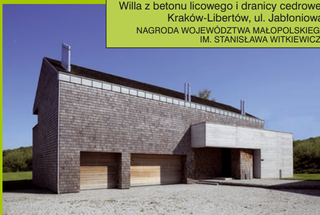
Willa z betonu licowego i drancicy cedrowej. Kraków-Libertów, ul. Jabłoniowa. NAGRODA WOJEWÓDZTWA MAŁOPOLSKIEGO IM. STANISŁAWA WITKIEWICZA